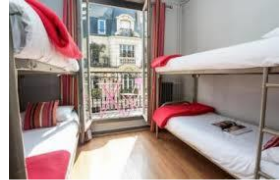
Auberges de jeunesse