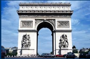
Arc de Triomphe