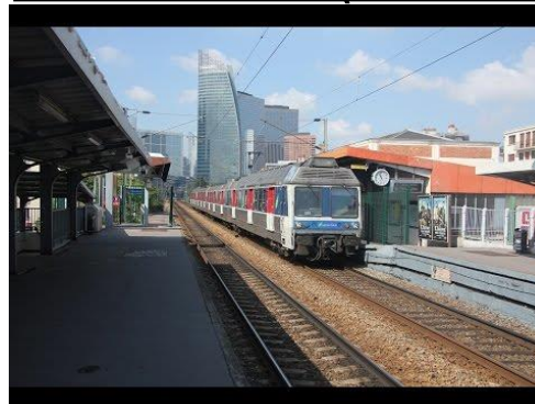
-Le Transilien ( le train )