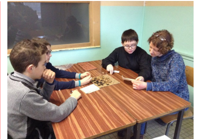
Pas évident, si les règles sont rédigées en latin !