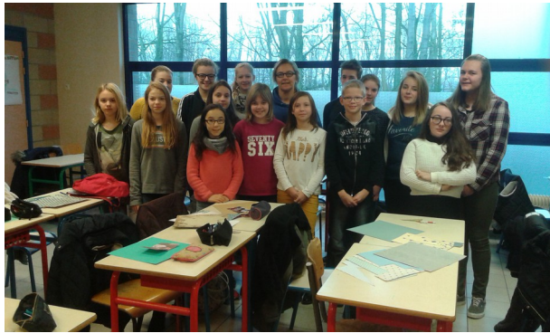
On est prêts à créer !