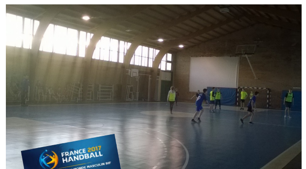
L'esprit collectif dans le fair play !