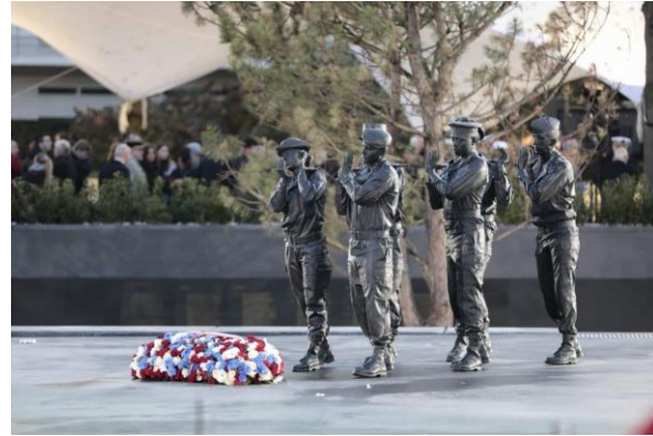
Un premier monument aux morts pour l'OPEX érigé dans le Morbihan.