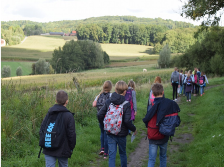
Journée d'intégration 6e