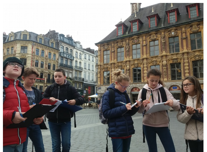
Les 6ème D sur la Grand Place de Lille pour découvrir les caractéristiques d'une métropole