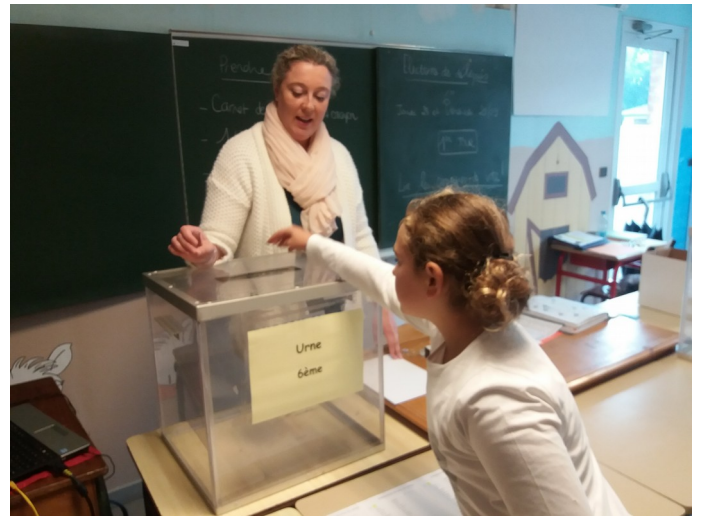
L'élection des délégués de 6ème au BDI