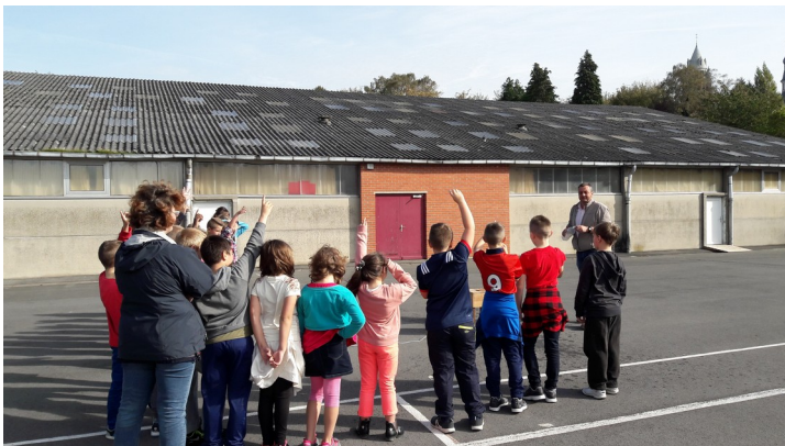
Visite des CM2 pour découvrir le collège