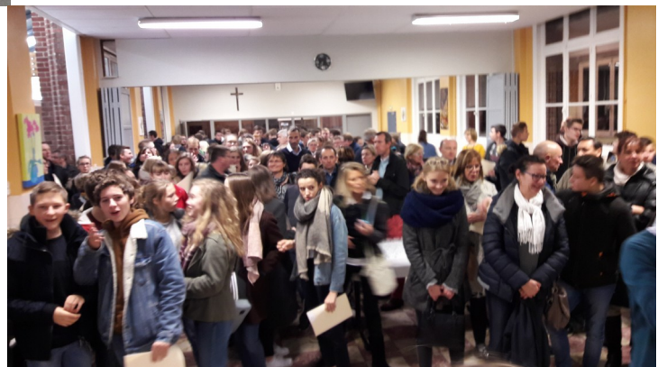
Remise du DNB 2017 !