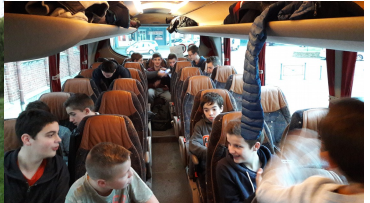
En route vers Werne !