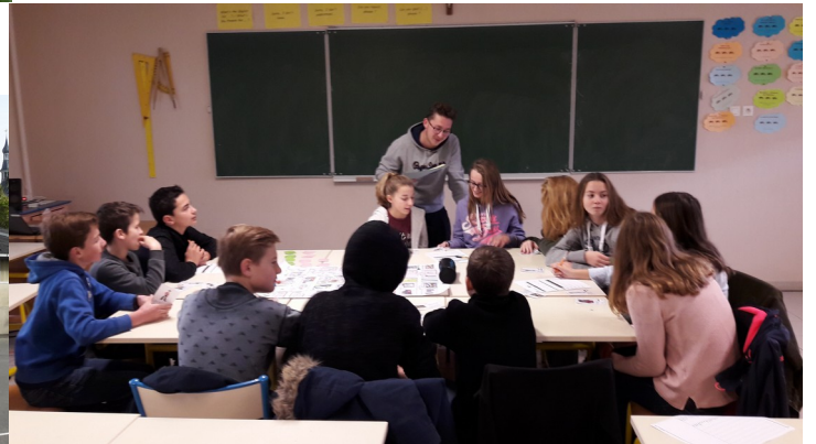
Intervention de la ville auprès des 4ème-3ème