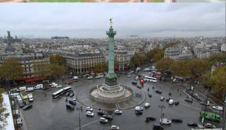
La place de la Bastille