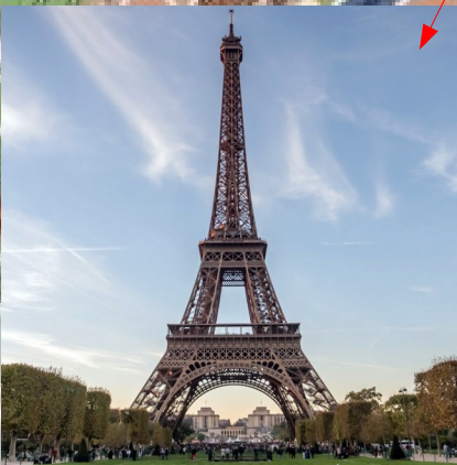
La Tour Eiffel